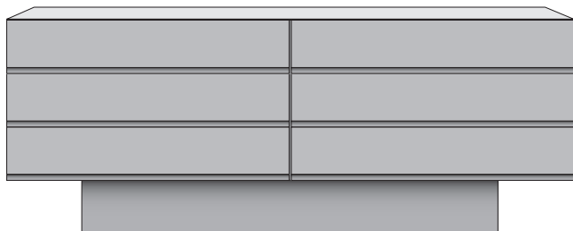
FACE 4 Sideboard B 190 x H 60 x T 42 cm mit 4 Schubfächern